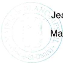
Jean-Philippe Ranquet Maire du Blanc Mesnil