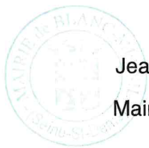
Jean-Philippe Ranquet Maire du Blanc Mesnil