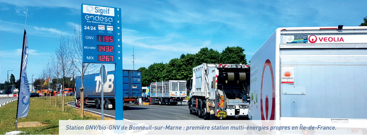
Station GNV/bio-GNV de Bonneuil-sur-Marne : première station multi-énergies propres en Île-de-France.